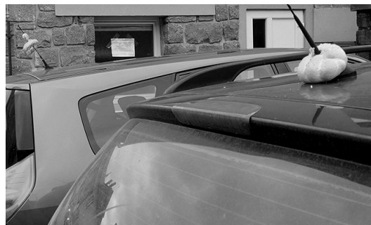
Neznámý vtípaček v sobotu ráno v sedlcanské ulici Na Potůčku přizdobil antény zaparkovaných automobilů...