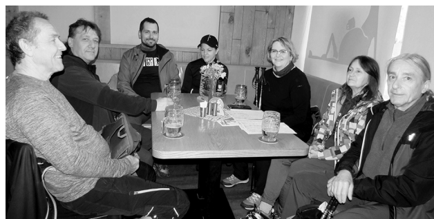
Před pochodem přišlo jedno pivo vhod.

Už od osmé hodiny ranní se před Kozlovnou, ve které pořadatelé vydávali letáky s pravidly