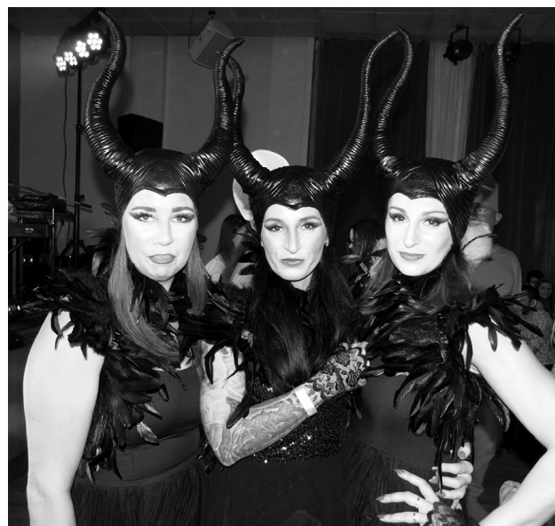
Pozornost vzbuzovaly také dívky z pohádky Zloba.

po dlouhá léta proslulé pestrobarevnosti svých masek, které se každoročně obměňují a obvykle se na stejné místo nevracejí. Tentokrát do kulturního domu přiféřela také moucha tse-tse, z Washingtonu D.C. přiletěl americký prezident se svojí