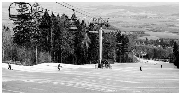
Na Monínci se ještě lyžuje.