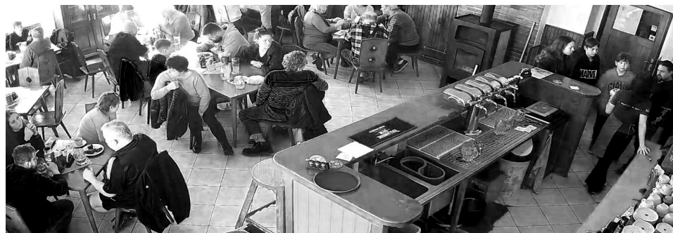
Osečanská hospoda často téměř praskala ve švech.

Hyský pořádá po druhé. Dle jeho slov se letos zúčastnilo asi sto hostů a další si přijeli pro výrobky, aby si je vzali domů. Nabídka byla tradiční – udělali asi 25 kg vepřového ovaru, 100 porcí zabijačkového gulá-