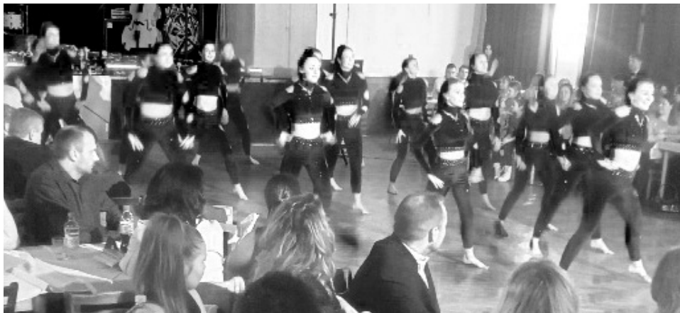
Nová soutěžní sestava nejstarších dívek Crazy Dolls

a věnuje se převážně disco dance. „Slimka má letos celkem 111 členek včetně přípravky," říká zakladatelka a hlavní trenérka Gabriela