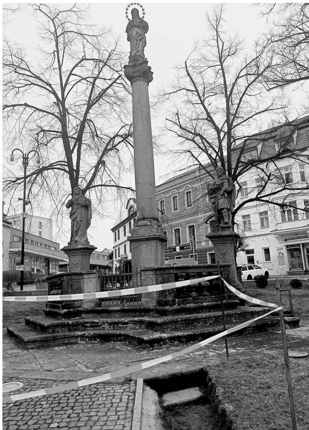
Výkopové práce pod morovým sloupem byly přerušeny nálezem starého schodiště.

Další postup teď čeká na vyjádření památkářů. „Byl bych moc rád, aby se naše barokní památka jen nekrčila překrytá hlínou, pod kterou bychom ji znovu zahrnuli, ale aby schodiště zůstalo odkryté a barokní památka, a s ní i celá horní část náměstí, dostala zajímavější a důstojnou perspektivu. Na komplexnější architektonické řešení okolí sloupu a jeho zapojení do náměstí bychom měli začít pracovat a určitě to budeme projednávat v komisi pro architekturu. Pojďme ale po krůčcích a nekladme si zbytečně překážky, když výsledek můžeme mít hned – teď odrýpat hlínu zakrývající šedesát let barokní památku a okolí osít travou nebo doplnit záhon růží a složitější řešení připravovat do budoucna,“ uzavírá Růzha. Blanka Vilasová