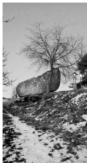
Ve všech pověrách o Vrškámeni figuruje čert.

PETROVICE Pěšky zhruba 900 metrů jihovýchodně od petrovického náměstí a necelých 100m od posledních domů se na kraji obce nachází přírodní památka zvaná Vrškámen. Jde o balvan s rozměry 350x550 cm a výškou 320 cm. O kameni existuje mnoho různých pověstí, ale všechny nesou jedno společné téma, a to je čert nesoucí kámen na řetězu. Proto se také kameni někdy říká Čertův.