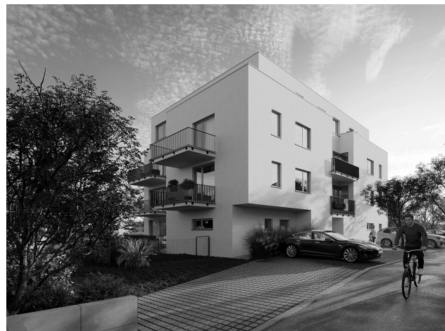
Vizualizace nové bytovky, která vzniká naproti Kovodružstvu.

Všechno je odvislé od kolaudace. Jakmile bude vydán kolaudační souhlas, můžeme předávat byty