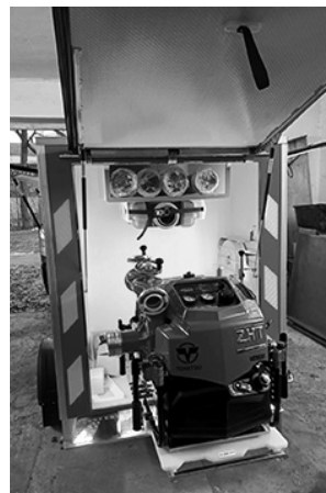
Nový přívěs pro hašení

konná japonská motorová stříkačka Tohatsu VE 1 500,