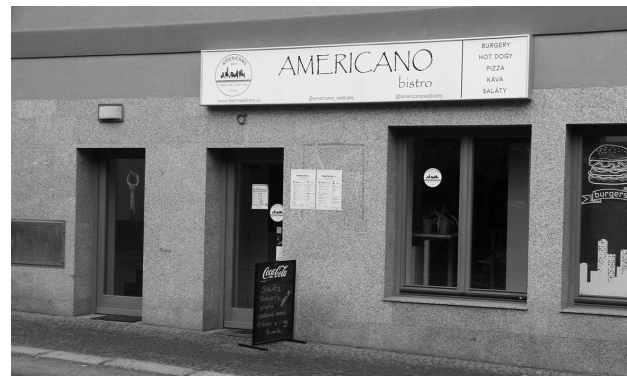
Bistro Americano v Nádrazní ulici je jednou s poškozených provozoven.

Ano, jednou se to už stalo, a to zhruba před rokem. K vloupání došlo zcela stejným způsobem. Také tenkrát se nám z pokladny