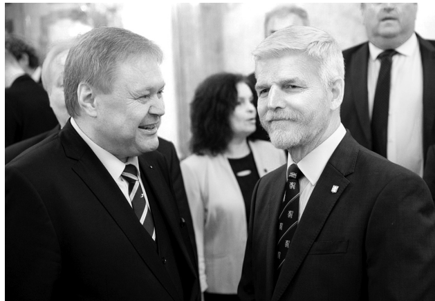
Senátor Petr Štěpánek s prezidentem Petrem Pavlem

na 350 tisíc korun. Co mě osobně mrzí, byl neúspěch mého návrhu na změnu zákona o volbách do zastupitelstev obcí. Volební systém, a hlavně způsob rozdělování mandátů v tomto typu voleb podle mě, ale hlavně podle předních