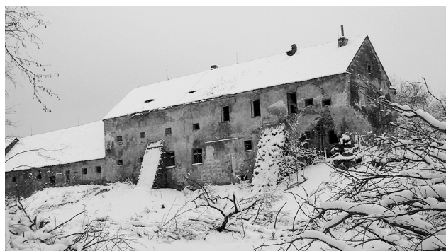
Uhřická tvrz, sídlo Radeckých