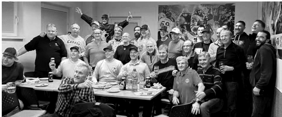
Na ledě byli soupeři, ale po zápase v restauraci výhradně kamarádi.

Po skončení mače oba týmy zapožovaly fotografům, aby mohl být na pa-