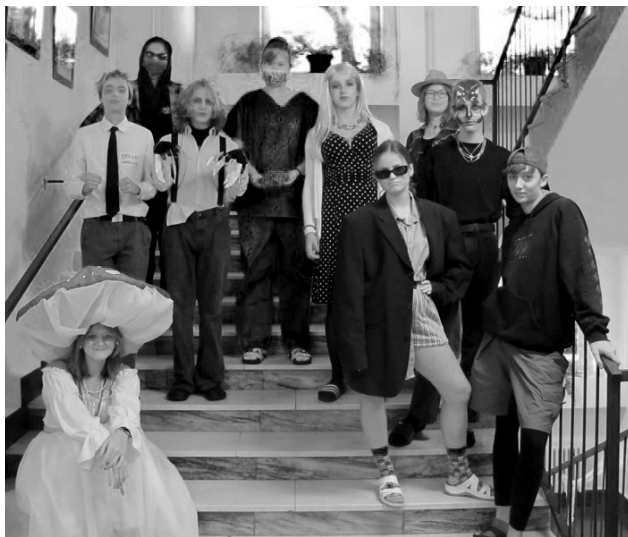
Studenti v kostýmech

„Na letošním Halloweenu si mi líbilo, jak se do akce zapojilo mnoho studentů, a dokonce i někteří učitelé. Snad