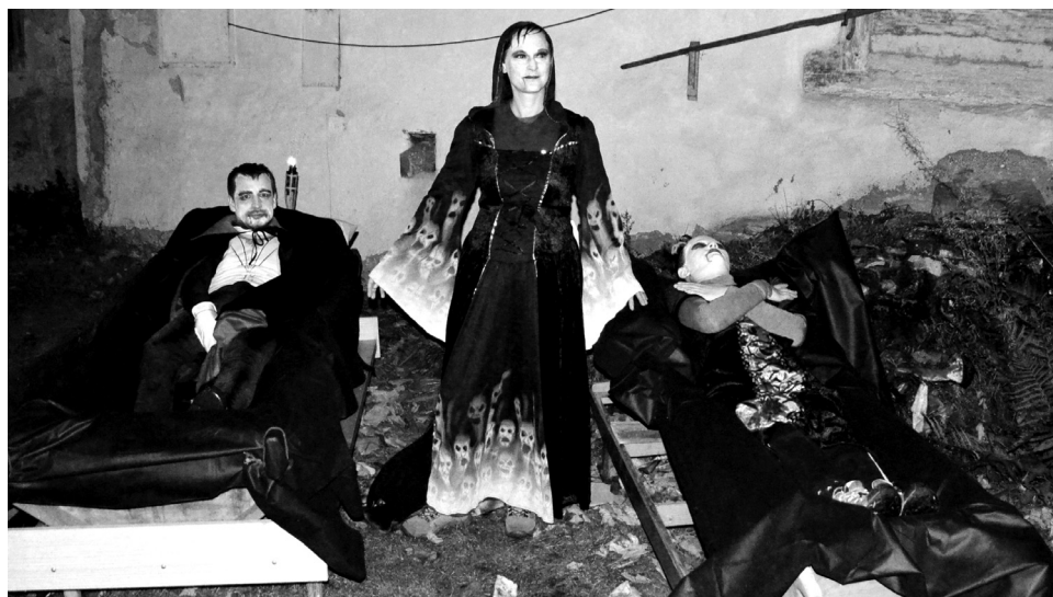
Upíří rodina si ustlala kousek od Obděnic.

OBĎENICE První listopadová sobota patřila v Obděnicích strašidlům. Sraz dětí s doprovodem, které chtěly místní strašidla poznat, se