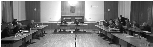
Zastupitelé při jednání 6. listopadu v kulturním domě