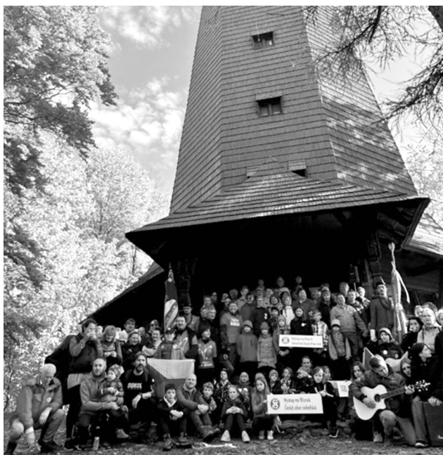
Účastníci letošního výstupu na Blaník 28. října

„Letošní výstup byl výroční, konal se již po dvacáté. Počasí se vydařilo, pochodníků byly desítky, vlajkonošům v tradičním kroji to slušelo. Krátké projevy připomněly cíle sokolské myšlenky, a to vlastenectví k Čechům a soli-