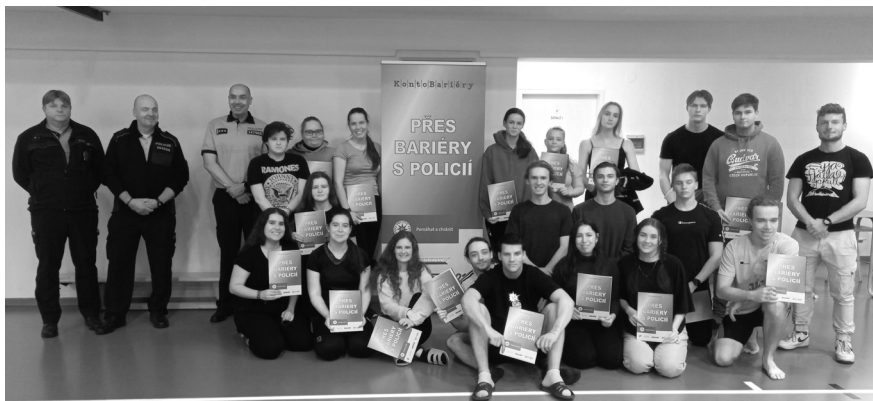
Studenti GaSOŠE absolvovali fyzické testy ve spolupráci s příslušníky Policie ČR.

mít po vykonání maturitní zkoušky zájem o práci u policie a projdou ještě psychologickým a zdravotním vyšetřením, mohou rozšířit řady příslušníků policie. Tímto způsobem chce Středočeská policie také podpořit náborovou