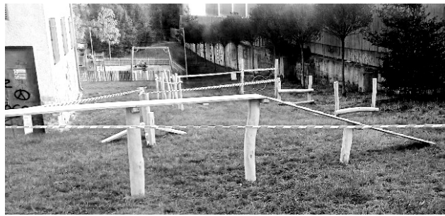
Psí agility park v Sedlčanech

V tuto chvíli u parku ještě chybí oplocení, poté bude pozemek uzavřený a umožní nejen zábavu, ale i výchovu psů ve městě. -bv-