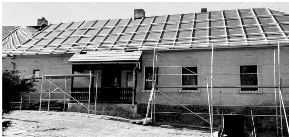
Stavební a částečně i demoliční práce začaly 19. října v oblíbené předbořícké hospodě U Kaštanu. Stavební dělníci začali střešou, v plánu je i celková renovace sociálního zařízení. Rekonstrukce hospody by měla být hotova do konce listopadu.