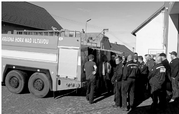
Hasiči prošli školením.

školení pro 32 strojníků. Vysoký Chlumeč se stal místem, kde pod vedením