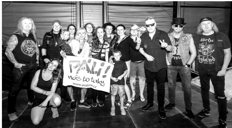
Avalone na pódium festivalu Hradý CZ

Děti z Avalone společně se svými rodiči v poslední době absolvovaly ještě několik dalších akcí. Zúčastnily se charitativního Běhu pro válečné veterány, Barevného běhu pro děti a navštívily svoje nemocné vrstevníky na onkologickém oddělení v pražském Motole. V po-