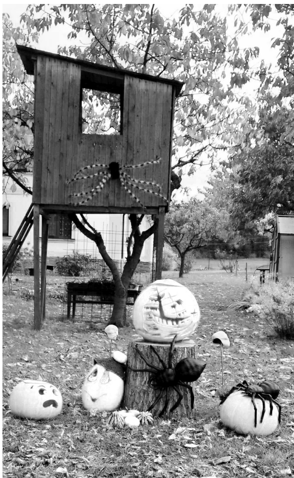
Originální a nevědní výzdoba zahrady se nachází ve vesnici s příznačným názvem Krchov.