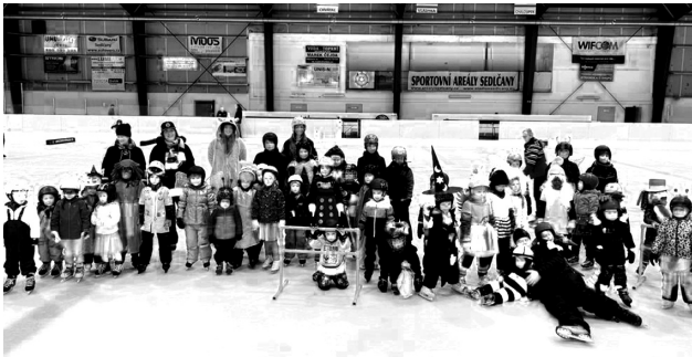
Školička bruslení každoročně vrcholí karnevalem na ledě.