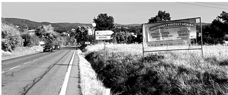
Ilustrační fotografie z kraje Sedlčan. Podobné reklamy by měly být omezeny.

(mnohdy vyšisovaný, nebo s utřeným rohem, takže ona reklama ani není pořádně čitelná) nebo mezi dvěma dřevěnými plaňkami zatlučenými do trávníku, moc důstojnou reklamou nejsou. Ať se na mě nikdo z těchto inzerentů nezlobí, ale někdy mi přijde, že ten reklamní banner věšel jakýsi Pat a Mat z oněch večerníčků. Ptám se proto vás všech, kteří reklamu