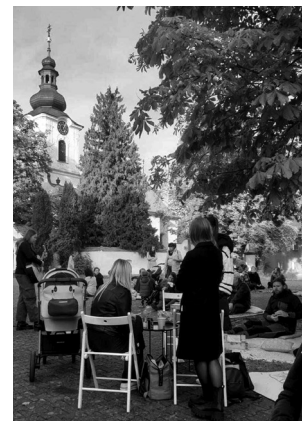
Okolí pojízdné kavárny se zaplnilo jejími příznivci.