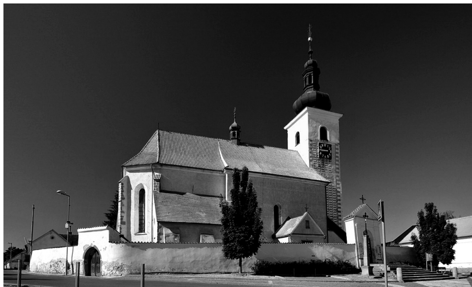
Románský tribunový kostel sv. Vavřince v Prčici

se stal podpurkrabím na krumlovském zámku, o rok později nastoupil na místo purkrabího. Roku 1566 se Krčín oženil, měl dluhy a potřeboval peněz. Na to je nejlepší nevěsta s velkým věnem. Tu se mu podařilo najít, stala se jí vdova Slepíčková, která do manželství přinesla dům v Krumlově a především peníze. Není ale růže bez trní a ani toto spojení nebylo jen růžové. Krčínovi bylo v té době jednatřicet let a nevěsta byla o „pouhých“ třicet let starší. Krčín ovdověl až roku 1587.