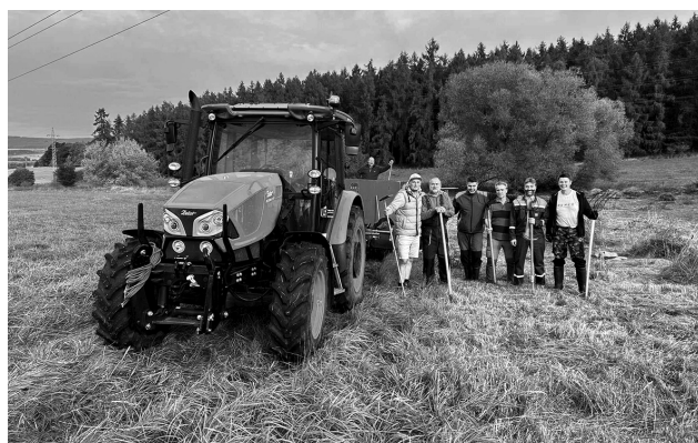
Dobrovolníci při údržbě mokřadu v Květné

Do velmi prospěšné práce v mokřadu se tentokrát zapojili zaměstnanci společnosti ČEZ z celé republiky. Pro většinu dobrovolníků šlo o zpestření a příjemnou změnu prostředí, neboť obvykle sedávají celé dny v kancelářích. „ Jsem zde již osmý rok a občas je podobná aktivita lepší než firemní školení. Je to relax, “ řekl