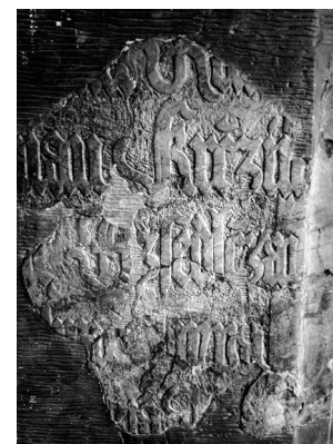
Fragment náhrobní desky z Prčice