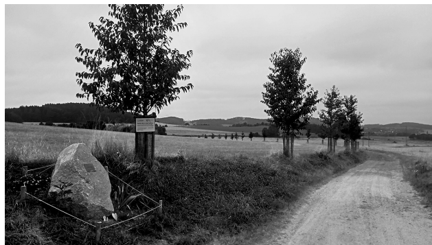
Pamětní kámen v Aleji Tomáše Hellera