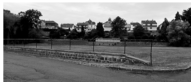
Tento plot na Mrskošovně už brzo nebude.