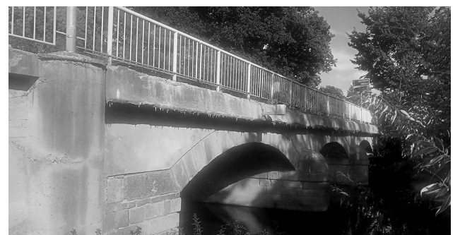
Dezolátní stav přemostění přes Mastník

Nádražní ulice opravovat, mohlo by jít o vhodně spojení,“ řekl Janeček. -bv-