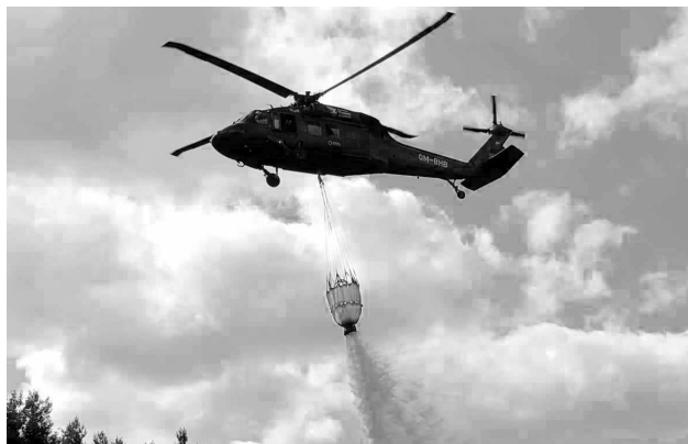
Posádka Black Hawku procvičila hašení lesních požárů, náběr vody z vodní nádrže a několik shozů.

Od 15. července do 15. září 2023 budou držet pohotovost dva vrtulníky Sikorsky UH-60 Black Hawk. Společně se dvěma Bell 412 HP/EP Letecké služby Policie ČR tak budou k dispozici čtyři vrtulníky. Jedná se o násobné navýšení hasební kapacity, protože Bell v bambivaku unese