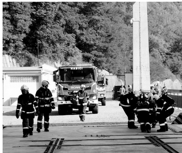
K požáru oleje vyjely dvě jednotky hasičů.

Dle dohody o plánu cvičení vyslal operační důstojník do elektrárny jednotku sboru dobrovolných hasičů obce Solenice, která vyrazila s cisternou a dopravním autem. Na místo byla vyslána i profesionální jednotka z centrální hasičské stanice Příbram. Ta vyrazila se dvěma cisternami a velitelským vozidlem. Skoro by