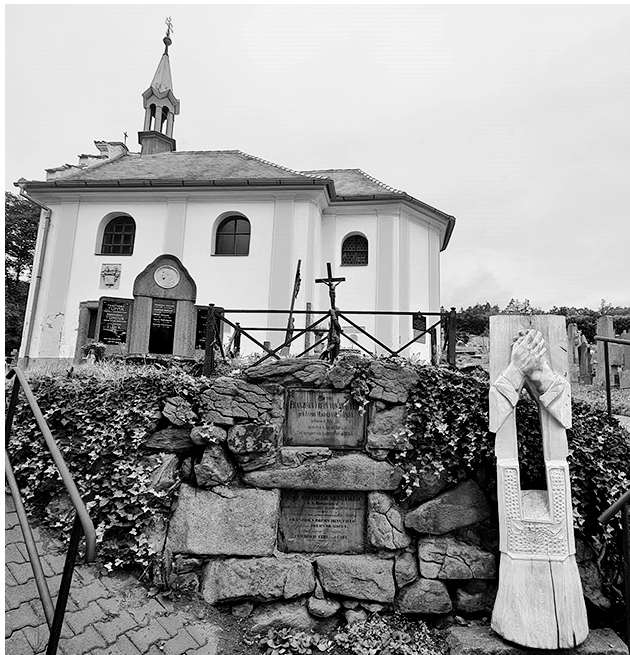
Nová dřevěná plastika na hřbitově v Kosově Hoře

předtím dřevo vysychalo u něho ve stodole po celou zimu. „Ještě předtím jsem ale ze syrového dřeva vyřezal, aby nepraskalo, tvar sochy, a udělal jsem dozadu delatační řez, aby to pracovalo v řezu a nepraskalo to do rukou dopředu. Na jaře jsem již suché dřevo dobrousil a následovaly nátěry,“ popsal postup své práce řezbář a na otázku, nakolik se mu jevil vybrané dřevo ze starých stromů kvalitní, odpověděl, že dřevo bylo velmi pěkné. Poznal, že v místě byl zřejmě dostatek vody, a část stromu, který vybral, ne-