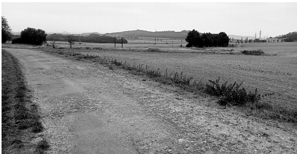
Cesta Doubravice – Oříkov, vpravo je vidět Alej Tomáše Hellera.

Na zničeném úseku je také odbočení k Sedlčanům přes Alej Tomáše Hellera. Celá oblast