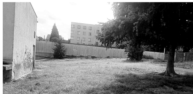
Lokalita pro agility park nad trafostanicí u Rákosníčkova hřiště

Po osobní schůzce starosty Janečka a dalších zástupců