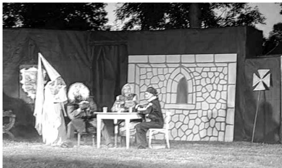
Představení Obecně prospěšná strašidla zahráli ochotníci v zámeckém parku.

PETROVICE Zámecký park v Petrovicích se stal v sobotu večer 16. září místem, kam ochotníci ze spolku BOSA (Buličinský ochotnický soubor amatérů) spolu s KSK (Kulturně-sportovní komise) obce Nažovice, přivezli svoji strašidelnou komediální divadelní hru Obecně prospěšná strašidla.