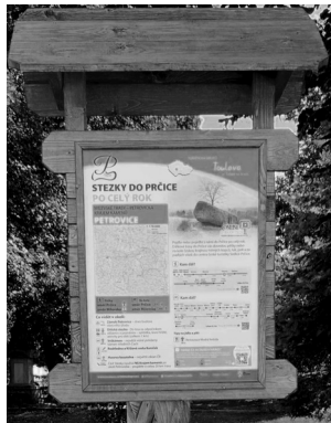
Rozcestník v Radešicích odnesl zloděj. Ten na petrovickém náměstí stále stojí na svém místě.

PETROVICKO V posledních dnech byly instalovány nové rozcestníky Toulavy v Petrovicích, Obděnicích a Radešicích. Rozcestníky informují, jak dojet po nové stezce až do Prčice. Ten instalovaný ve středu 6. září v Radešicích někdo ukradl za pouhý den. Petrovický obecní úřad na sociálních sítích zveřejnil prosbu o informaci, pokud by jej někdo objevil. -jm-