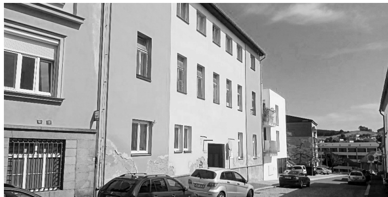
Stará poliklinika v Tyršově ulici před rekonstrukcí

nyní denně provozuje také ordinaci praktického lékaře a přijímá nové pacienty,“ říká Janeček a pokračuje: „Budu se snažit, aby byly do Sedlčan nauráceny ambulance, o které jsme v minulosti přišli a aby byly udrženy ty, které u nás již máme. Rád bych také, aby se péče případně rozšířila i o nové obory. To samozřejmě souvisí i s tím,