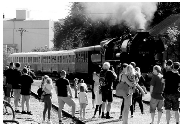
Jako první přijel v sobotu na sedlčanské vlakové nádraží Sedlčanský spěšňák, který se ocitl v obležení přihlížejících.