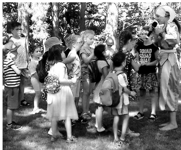
Pro záchranu princezny by děti pod pokyny šaška udělaly cokoliv.

U stánků byla vlídná obsluha, v některých čepovali sami sládkové, takže byla příležitost dozvědět se i o nových technologi-