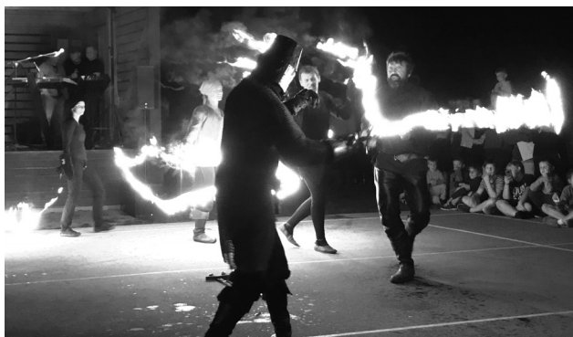
V ohnivém show diváci viděli souboj rytíře s drakem.