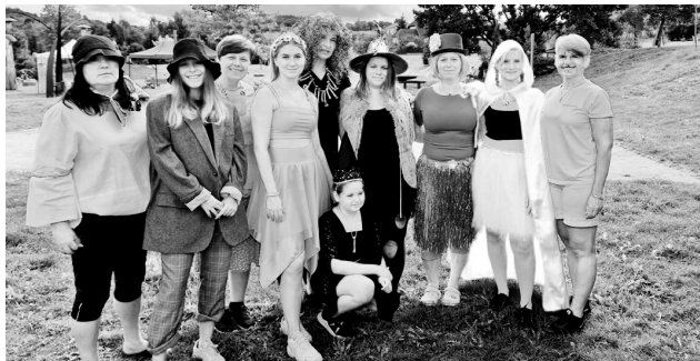
Pohádkové postavy na Dni plném her v Kosově Hoře

rála Mareše uspořádal Den plný her, jehož součástí bylo téměř hodinové šermířské vystoupení Pánů ze Zvěřince, dobrovolní místní hasiči pro děti vyrobili pěnu, ve které se malí účastníci akce mohli vydovádět, a nechybělo také putování za pohádkou.