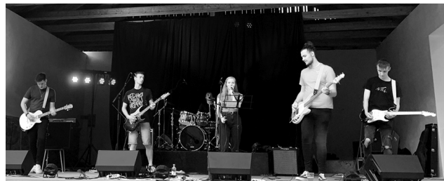
Většinu večera si návštěvníci poslechli mladou sedlčanskou skupinu Kaktus Verde.

Akci nezakazily ani dvě krátké deštové přeháňky, které se nad petrovickým zámeckým parkem přehnal. Melodie Mladé generace prokázala, že region nabízí spous-