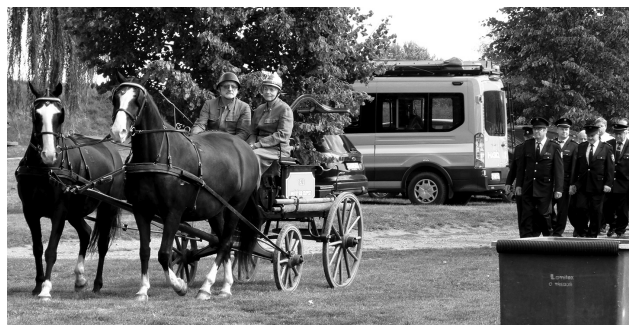
V čele průvodu hasičů a dalších účastníků oslav jelo dvojspřeží koní, táhnoucí historickou stříkačku.