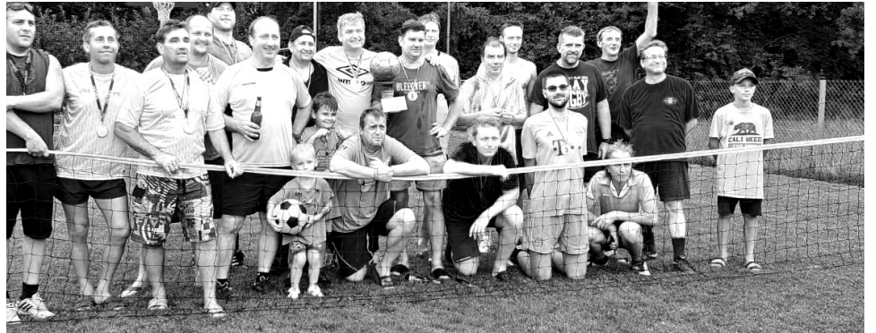
Účastníci nohejbalového turnaje na Vysokém Chlumu