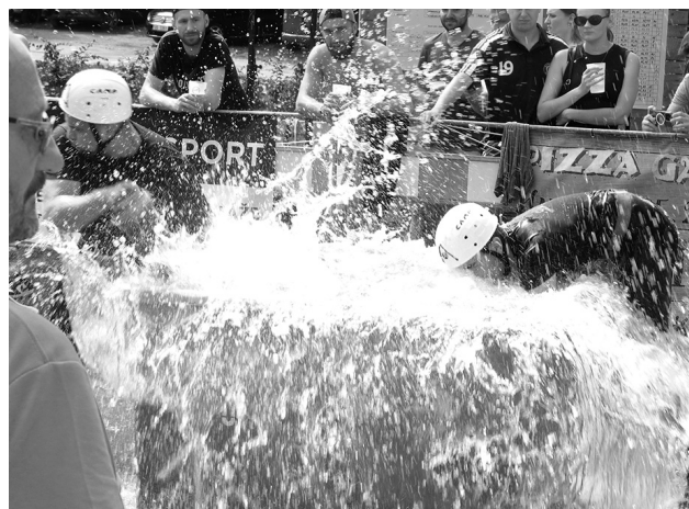
Na Mrskošovně nebyla nouze o dramatické situace.

do play off, Vranovice si to už pohlídaly a staly se vítězi letošního ročníku. V kategorii žen o svém celkovém vítězství rozhodly