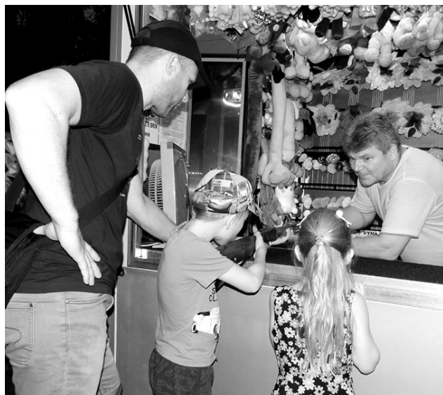
Kluci už na vojnu nechodí, tak se naučí střílet alespoň na pouti.

DUBLOVICE Zastupitelstvo obce schválilo rekonstrukci školní zahrady s novou venkovní přírodní učebnou a modernizaci školní družiny. Plánuje také výstavbu nové učebny a rekonstrukci školní zahrady pro mateřskou školu. Vše bylo zahrnuto do Plánu rozvoje obce a Strategického plánu MAP v rozmezí let 2023-2027. Bude však záležet na množství získaných dotací. -red-