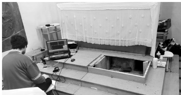
Pro navrtání otvoru do hrobky bylo zvoleno místo pod oltářními schody.