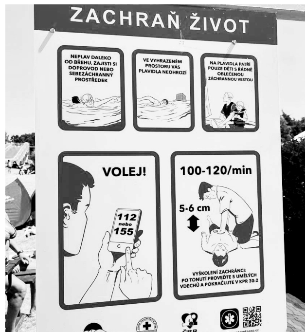
Bezpečnostní tabule jsou umístěny zatím u vodních nádrží Orlík, Lipno a Slapy.

Prezident Vodní záchranné služby ČČK, David Smejkal, doplnil, že plánují rozšířit instalaci tabulí také na řeky, které jsou využívány vodáky, a to především u jezů a kempů. Důležitou součástí projektu je edukace lidí ohledně poskytování první pomoci, a proto se ke spolupráci připojila Česká resuscitační rada. Navíc doporučují aplikaci Záchranka, která umožňuje volání zdravotnické zá-