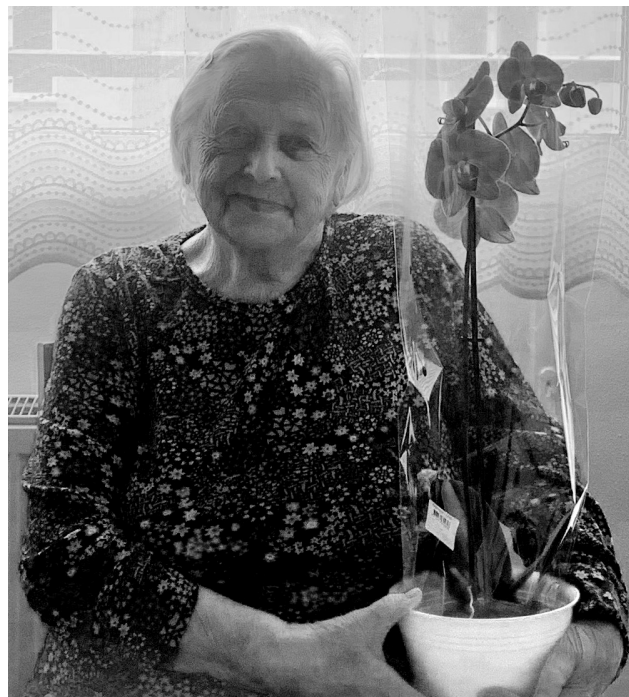
Oslavenkyně s květinou, kterou od zaměstnankyň Domova obdržela k oslavě svých 102. narozenin.

va poblahopřála oslavenci a předala jí dar v podobě růžové orchideje. Poté, co skončily gratulace, usedla za akordeon a potěšila přítomné slavící klienty hu-