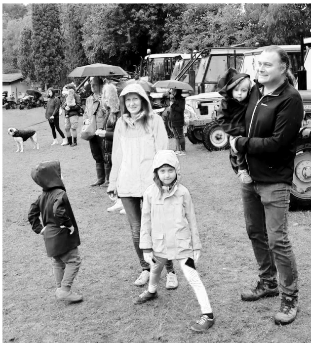
SVATÝ JAN V sobotu 5. srpna se i přes nepřízeň počasí konal 8. ročník traktoriády. Velký počet diváků si traktoriádu nenechal ujít. Návštěvníci dorazili v pláštěnkách, gumovkách, pod stanovými přístřešky se obcerstvovali a sledovali jízdy zručnosti. Užili si plno zábavy i v dešti.