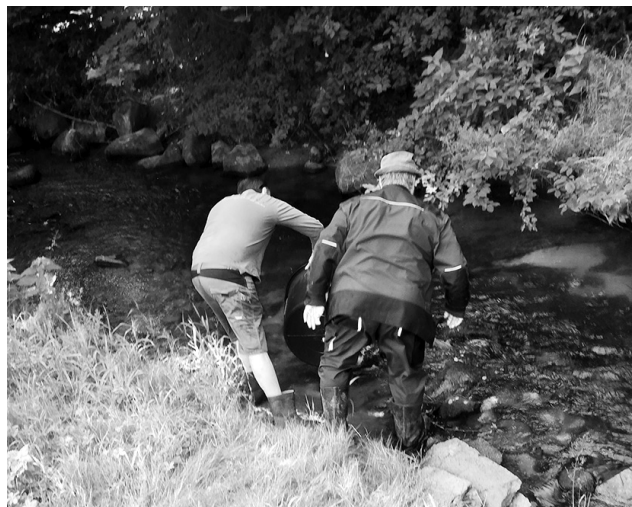
Sedlčanští rybáři vysazovali také sivena amerického.