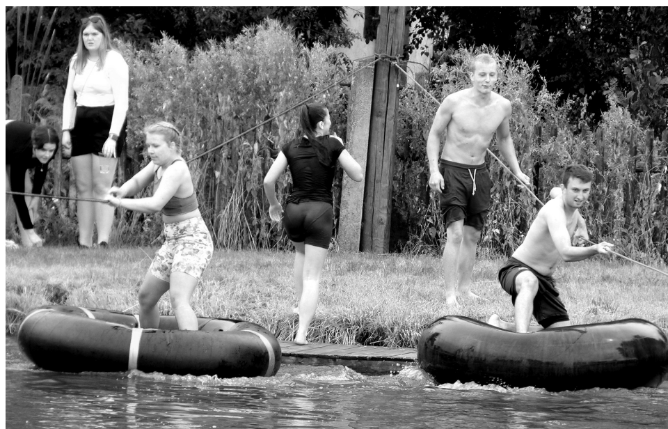
Ani na vodě nebyla nouze o dramatické okamžiky.