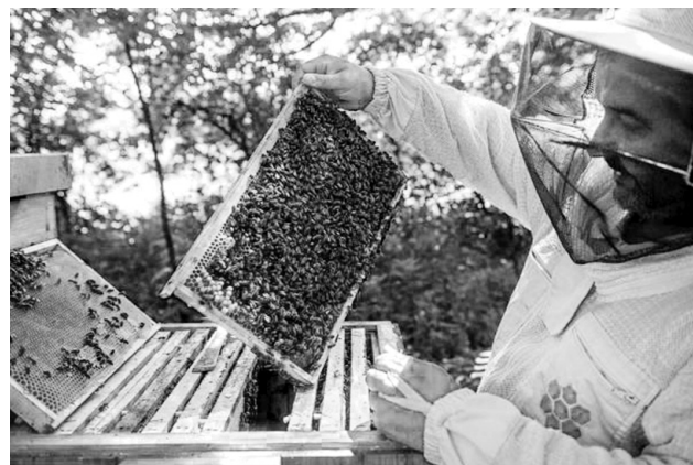
Produkce medu bude díky příznivým podmínkám na jaře zhruba jako v loňském roce.