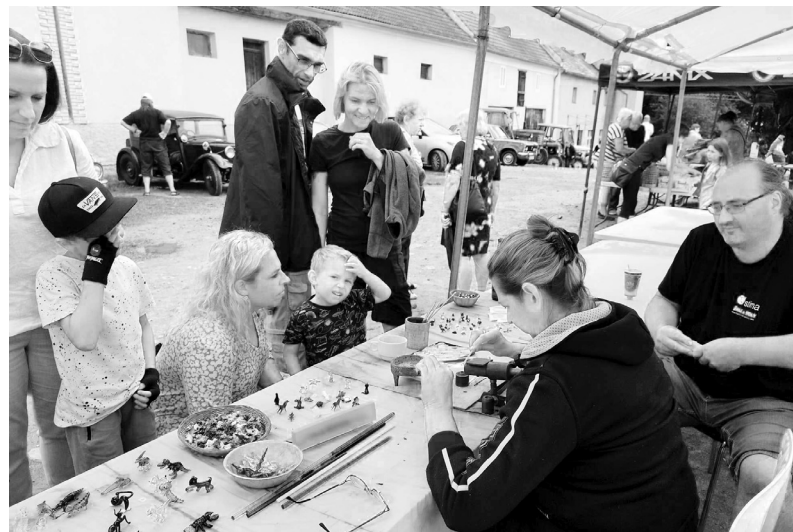
Výroba malých skleněných figurek zaujala všechny generace.

jste například, že klasický trakař nese hned několik názvů? Tůčko, kolec, luberna, korba... Pod tím