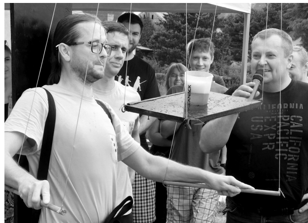
Vypití piva v zařízení pro loutkoherce nebylo jednoduché... Více o Lhoteckém pětiboji najdete na str. 6