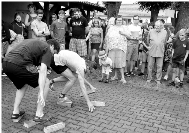
Už první disciplína, přendávání špalků a chůze po nich, nebyla pro soutěžící snadná.

Jeden z nich připravil pořadatel Vladimír Krejčí mladší, který nakonec celou soutěž společně se