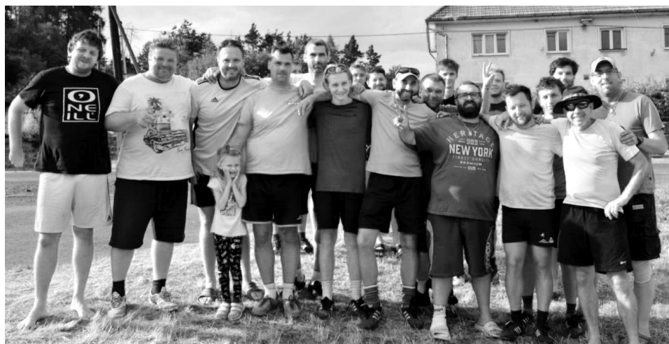
Většina účastníků devětačtyřicátého ročníku nohejbalového turnaje ve Zvíroticích