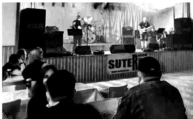
Zahájení večera v kulturním domě v Hrazánkách s kapelou Paradoxy

Hrazánecké dunění – prázdninové půlení, tentokrát lákalo na rockovou zábavu, kde hlavními hvězdami večera byly kapely Suterén a Paradoxy. Lidé se zpočátku scházeli pomalu, ale okolo desáté večerní se sál místního