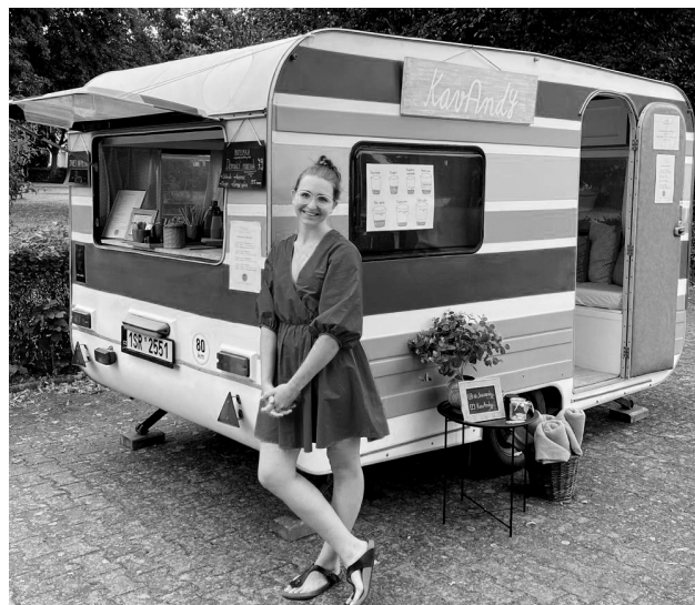
Nový, pruhovaný vzhled karavanu