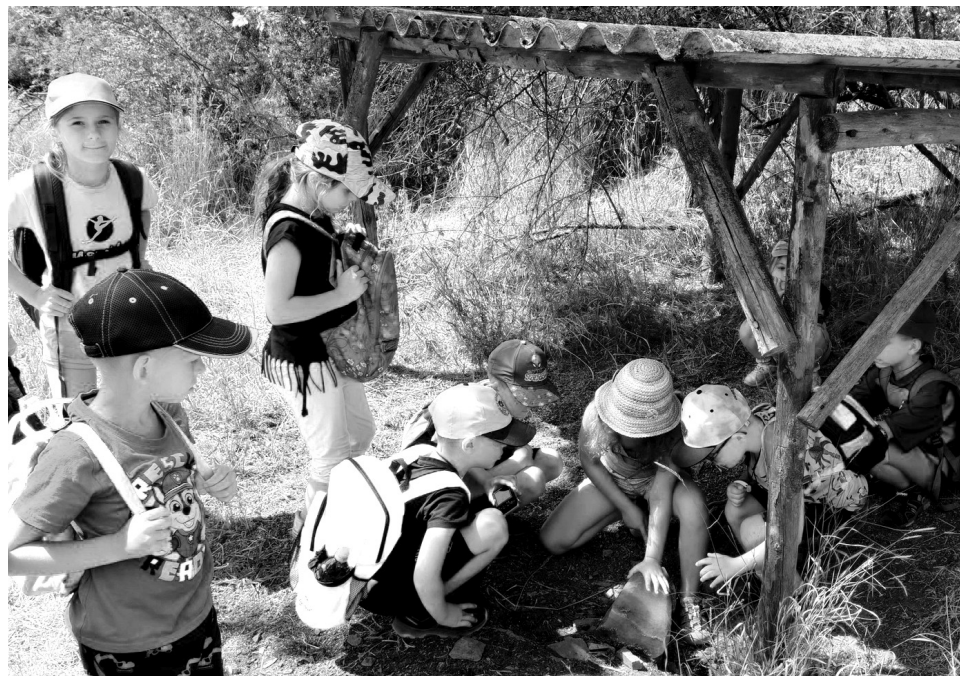
Kroužek mladých myslivců z Krásné Hory nad Vltavou má za sebou první tábor přežití. Více na str. 5