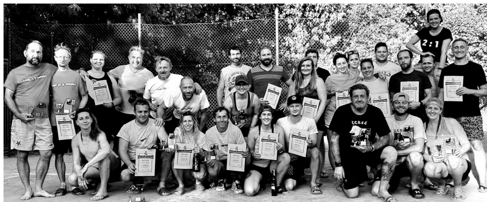
Ačkoliv panovalo tropické počasí, nohejbalisté si turnaj na Vysokém Chlumu pěkně užili.