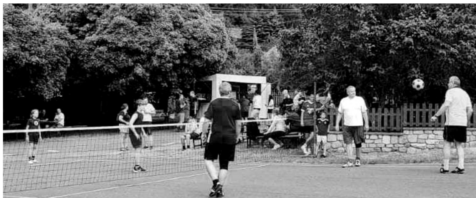
Celý výtěžek vzpomínkové akce pro dobrou věc poputuje onkologicky nemocným dětem.