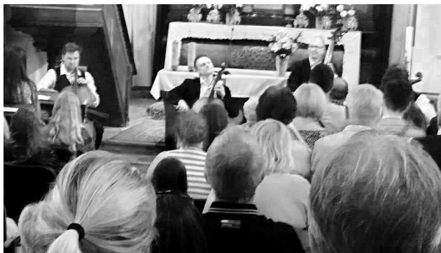
Čtveřice vynikajících hudebníků zaplnila kostel v Klučenicích až po strop.

ce, zda paní sedící v první řadě rozumí hudbě, protože mu celou dobu kouká do not. Posluchačka se smíchem odpověděla, že noty neumí, ale zajímá ji, co má umělec před sebou psáno. Tak plno bylo... „Hádejte, v jaké hodnotě jsou nástroje, na které vám dnes zahrajeme?“ zeptal se jiný z umělců. Nikdo z přítomných neuhádl, neb hodnota krásných nástrojů přesáhla několikamilionové hodnoty.