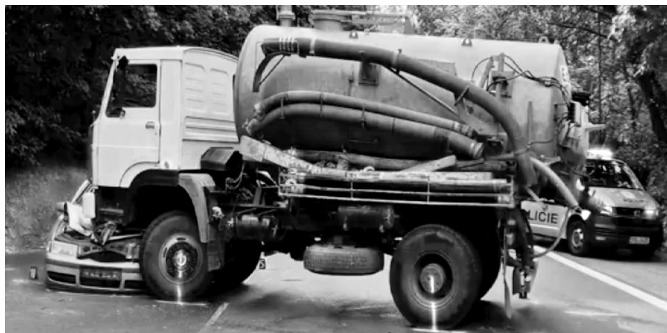
Celá přední strana osobního auta na straně řidiče byla sešrotována pod kabinou fekálního vozu.