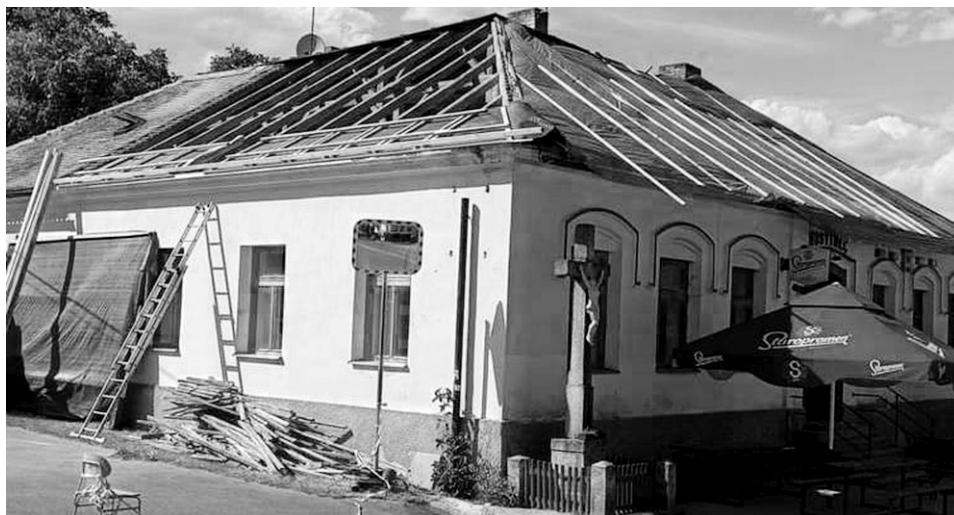
Hospoda v Obděnicích se dočkala nové střechy.