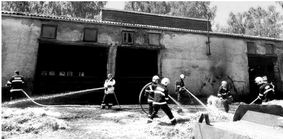
Požár se díky pozornosti občanů z Předbořic podařilo odhalit včas.