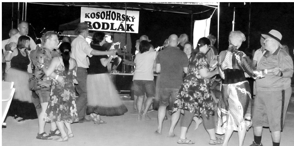
Kosohorský bodlák přilákal příznivce folku a country nejenom jako posluchače, ale i tanečníky.