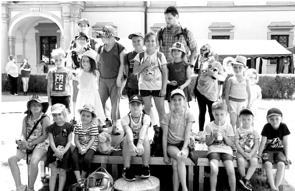
Krásnohorští mladí myslivci na Dětském mysliveckém dnu v Ohradě

udělat. Nikde v okolí nic takového nebylo. Děti máme pětáctileté. Mladších do šesti let chodilo letos dvanáct, ostatní patří do starší věkové kategorie. Scházeli jsme se pravidelně jednou