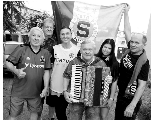
Sedlčanští příznivci fotbalové Sparty

O hudební doprovod na oslavě se postaral šestašedesátiletý harmoni-