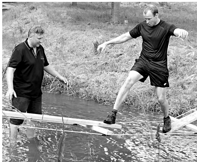
Překonávání překážek nebylo jednoduché.

A protože v Kosově Hoře máme krásný park a byla by škoda ho nevyužít, rozhodli jsme se uspořádat pro Kosováky a sportovce