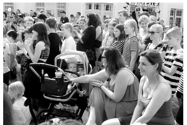
Dvůr se zaplnil dřívějšími, současnými i budoucími žáky školy.

Čtenáře čeká třicet fantastických receptů, které zvítězily v anketě Nejoblíbenější pokrmy ve škole Propojení. Každý recept je tvořen technologickým postupem, gramáží surovin na šest porcí a osobitými ilustracemi žáků 7. a 8. ročníku. Devět polévek, patnáct hlavních pokr-