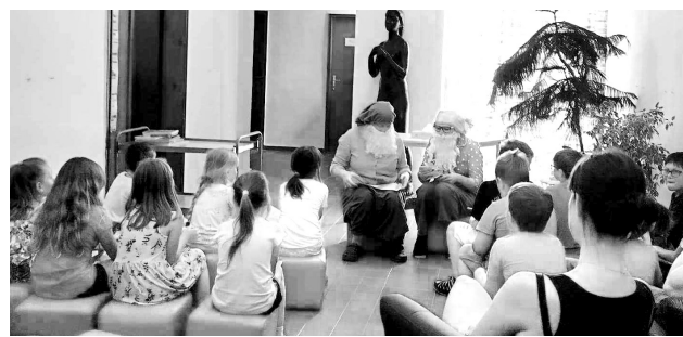
Prvňáčci z Petrovic se stali čtenáři.