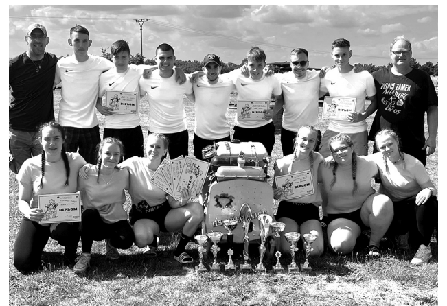
Na snímku jsou obě úspěšná křepenická družstva se svými trenéry.

Jde o historická umístění pro křepenická hasičská družstva a zároveň o premiéru pro ženský tým, kterému se podařilo poprvé postoupit a vyhrát prezidentské kolo. -vž-