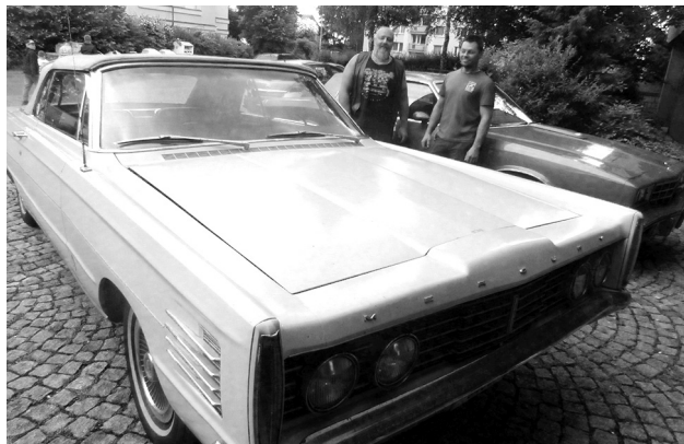
Lefi, zeť Kuba a jejich Ameriky

SEDLČANY V pátečním podvečeru o Rose se na parkovišti u kulturního domu před Besedou objevily dva osobní automobily, které se hodně vyjímaly mezi