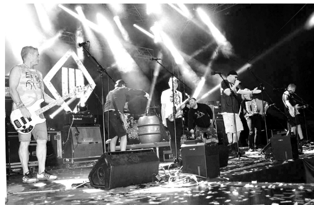
Tři sestry se připravují na vystoupení.

-rockové kapely Tři sestry. Celkem se prodalo (v předprodeji a na místě)