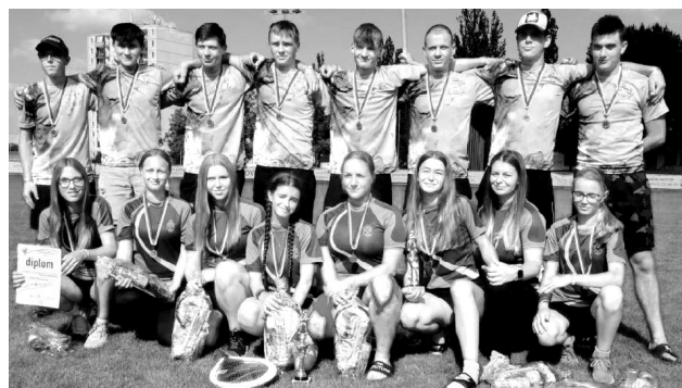
Mladí hasiči podali skvělé výkony.