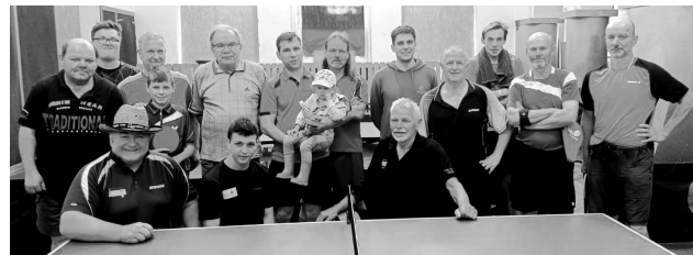
Účastníci turnaje ve stolním tenisu na Rose