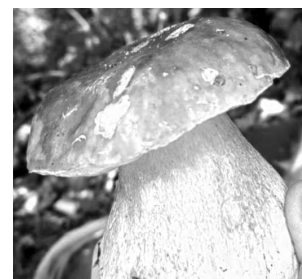
Letošní dubáky z hrází rybníků okolo Petrovic