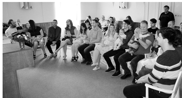
Převažovali chlapci, kterých bylo přivítáno sedm. Děvčata se narodila čtyři.

v doprovodu jejich rodičů, sourozenců a příbuzných. Pro starostu Kubíčka to