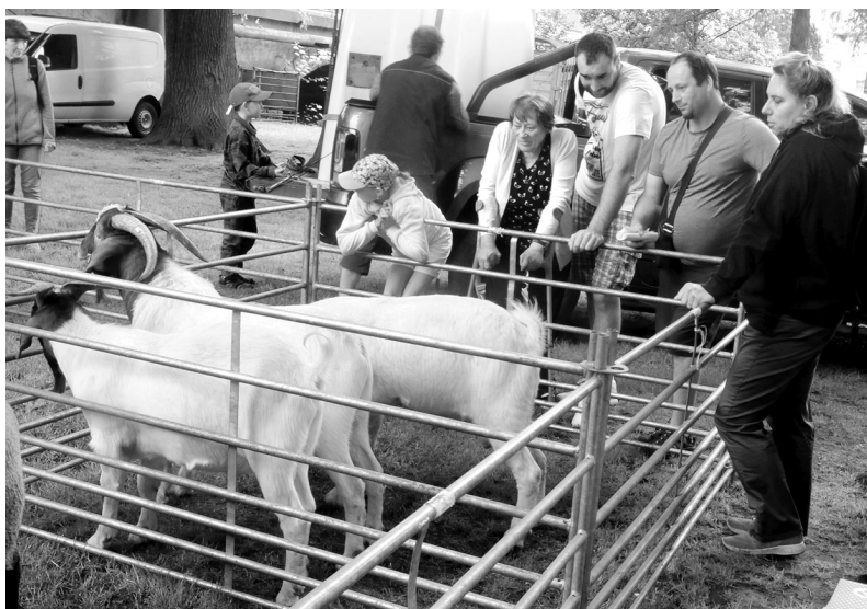
V chovatelském areálu se Den chovu ovcí a koz koná již tradičně.