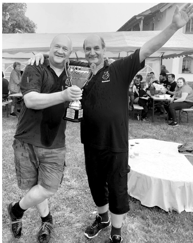
Vítězný tým Jaro dřímající v rukou putovní pohár pro vítěze Kosobudských kotlíků.

dili na značné množství zeleniny, další si pohráli zejména s pikantností. I týmy letošního třináctého ročníku kulinařského klání byly velmi pestré. Vařili jak zkušené dvojice, tak nováčci, ženské i mužské týmy, místní, ale třeba i kuchaři ze Slovenska.