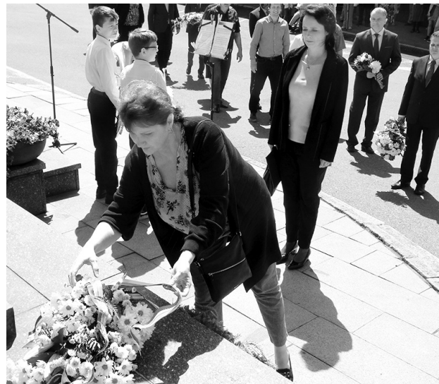
Účastníci pietního setkání přicházeli k pomníku Lidé bez domova položit květiny.

SEDLČANY U pomníku Lidé bez domova na Sukově náměstí se v neděli 11. června při příležitosti výročí osmdesátí let od vystěhování obyvatel, zrušení města a záboru Sedlčanska pro cvičiště jednotek SS v roce 1943 konalo pietní setkání, které