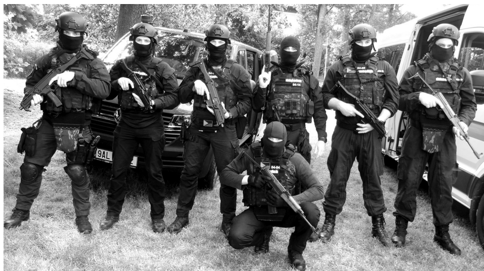
Skupina členů Vězeňské služby ČR na Bezpečném dni vzbuzovala respekt. Všichni účastníci si mohli být jisti, že plynulý program akce si nedovolí nikdo narušit.

ruku prince v pichlavém křoví v pohádce O Šípkové Růžence.