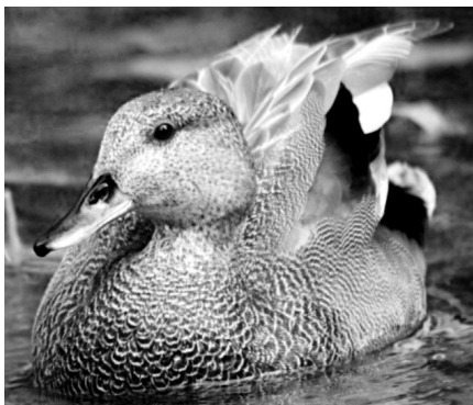
Na Musíku žije také kachna kopřivka obecná.