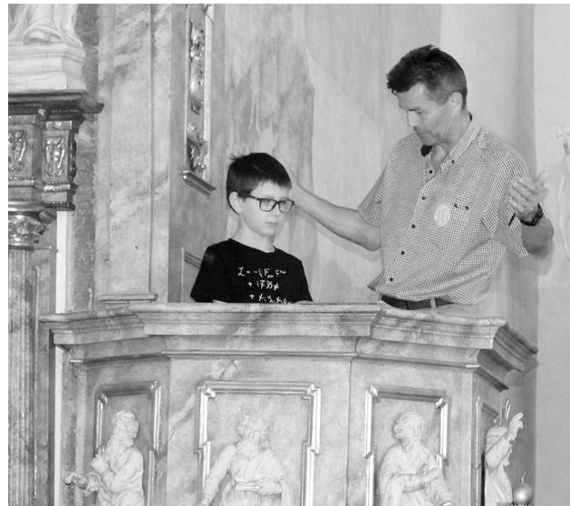
Návštěvníci Noci kostelů v kostele svatého Martina se mohli dostat do míst, kam jindy přístup nemají.

telů je určena pro veřejnost a pravidelné návštěvníky kostela, pro něž je obohacením jejich běžného duchovního