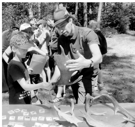
Děti načerpaly zajímavé informace nejen o paroží.

„Ale co to je za zvuky? Je tady snad jelen, či kachna? Nebo dokonce divočák?“