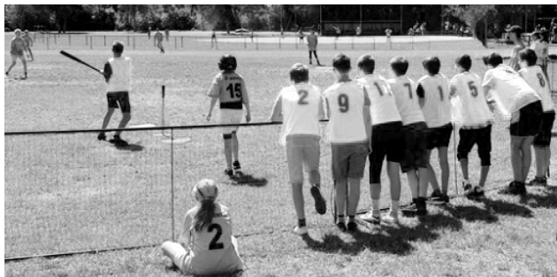
Školáci si turnaj v t-ballu užívali za pěkného počasí.

SEDLČANY Sportovní klub Pegas uspořádal ve dnech 29.–31. května pro místní školy turnaj v t-ballu. T-ball je průpravná hra pro softbal, která se hraje ze stativu. Pro letošní rok pořadatel sblížil pravidla hry s oficiálními pravidly vydanými softbalovou asociací, a zdá se, že změna