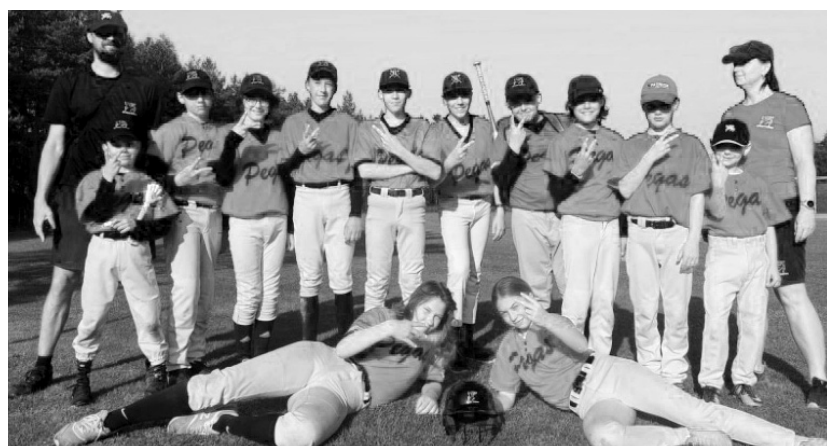
Žáci Pegasu na turnaji v Příbrami