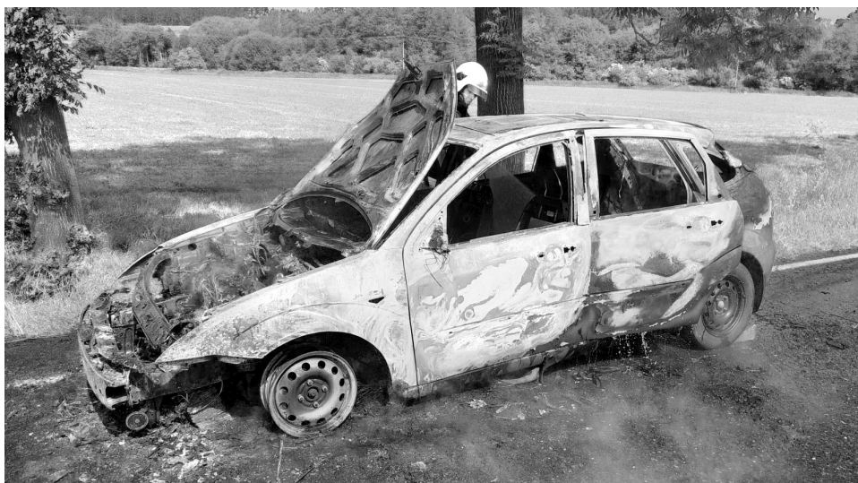
Shořelé auto nedaleko Krásné Hory.

REGION Hasiči měli v uplynulém týdnu plné ruce práce i mimo požáry. Ve čtvrtek byli povoláni do Doubloviček k oběšenému muži.