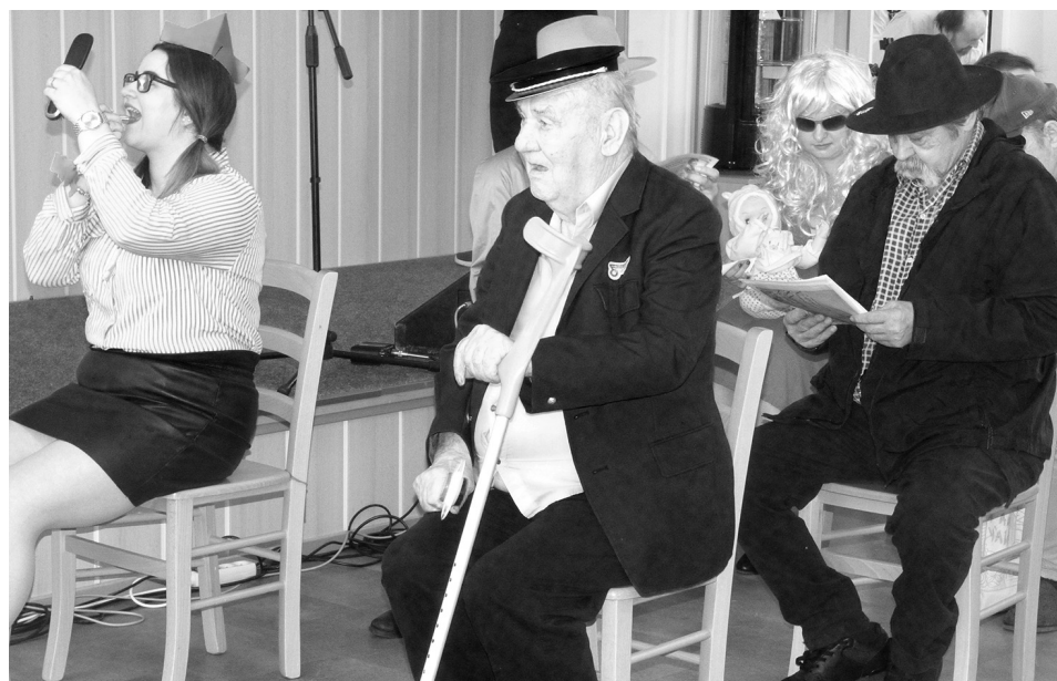
Klienti společně se zaměstnanci Domova Sedlčany se představili také ve scéně Jízda do neznáma.

SEDLČANY Domov Sedlčany, poskytovatel sociálních služeb, uspořádal ve čtvrtek 25. května den otevřených dveří, který se konal ve všech prostorách tohoto domova se zvláštním režimem pro seniory. Nechyběl doprovodný program, který tvořil tanec společně s hudbou a bohatým občerstvením. Pořadatelé nezapomínali ani na děti, pro které připravili na zahradě