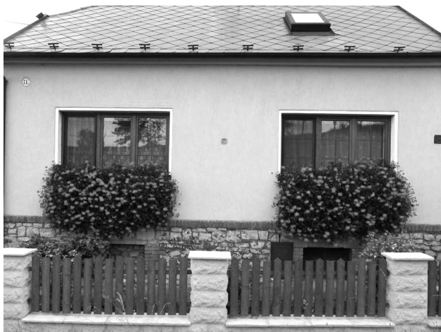
Kdo letos soutěž s nejkrásněji rozkvetlým oknem či domem vyhraje, je zatím ve hvězdách.

tech byla vždy oceňována první tři místa poukazem do zahradnictví Trávníček. Do soutěže se tradičně mo-