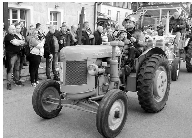
Traktory značky Zetor různého stáří měly v sobotu sraz v Nahorebch. Více na str. 3