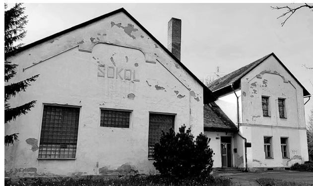
Pivovar, lihovar, hospoda. Zdá se, že pro sportovní využití není budova sokolovny dělaná.

„Chtěl bych z budovy udělat důstojné zdravotnické zařízení, které bude sloužit občanům a nebudeme se muset stydět za to, jak vypadá. Vní-