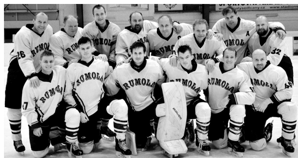
Rumola předvedla na ledě neuvěřitelné výkony.