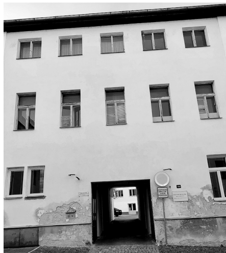
Budova polikliniky sousedí s nemocnicí, využití pro současné účely se tak nabízí.

Dokončení ze strany 1 Potenciál městské polikliniky je tedy zřejmý a vidí jej i starosta města. „Řešíme nedostatek lékařů ve městě a když už se nějaký lékař ozve, že by tady chtěl ordinovat, tak