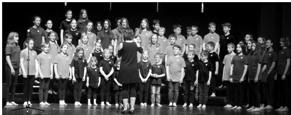
Koncert zpestřil dětský sbor Pikola ze Sedlce-Prčice.

založen roku 2015 při ZUŠ Sedlec-Prčice. Zpočátku jsme v něm měli málo dětí, ale nyní je jich už více než padesát.