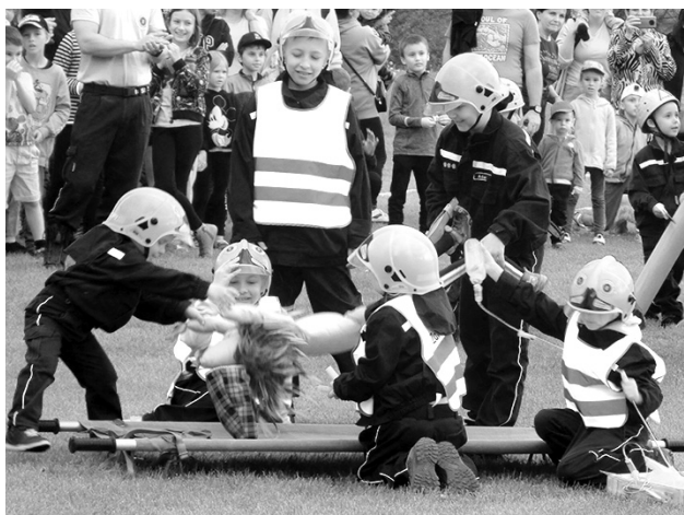
Malí hasiči zachraňovali svého maskota Alberta.

a spousta stanovišť byla určena výhradně dětem. Mohly se svést na šlapadlech, zachytat si s vodníkem ryby, přetahovat se lanem, zaskákat si mezi dvěma obrovskými nafukovacími hasičskými přístroji a absolvovat malou hasičskou dráhu, u které