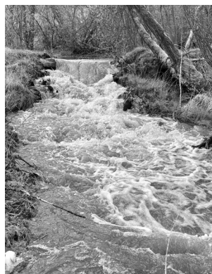
Rozvodněná Brzina.

REGION V pátek 14. dubna vydal Český hydrometeorologický ústav výstrahu.