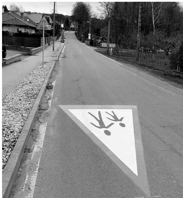
Na komunikaci u MŠ Čtyřlístek v Petrovicích je nové vodorovné dopravní značení pozor dětí.