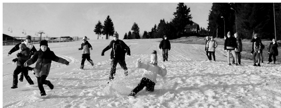
Děti ze Základní školy v Konečné ulici si na Božím Daru ještě užily i sních.