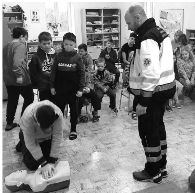
Starší žáci se učili resuscitaci na figuríně, mladší na plyšovém medvědovi.

Ti starší, od třetího ročníku výš, už srdeční masáž zkoušeli na resuscitační figuríně. Aby nemuseli zkoumat, zda zvládnou rytmus sto stlačení za minutu, hrála jim