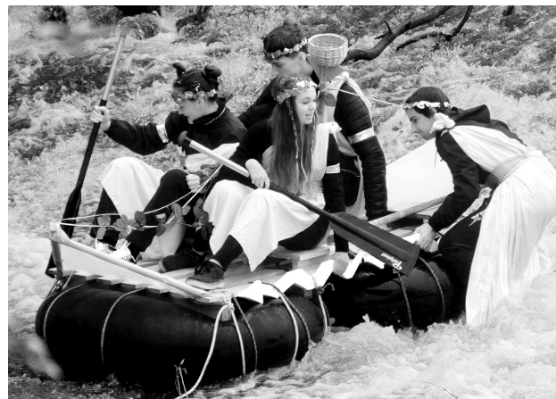
Většina plavidel uvízla hned po startu na jezu.

SEDLČANY Přestože velikonoční nedělní ráno bylo deštivé, k sedlčanskému jezu se už v časných hodinách v hojně míře začali