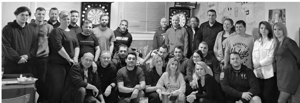
Společné foto účastníků velikonočního turnaje u terčů