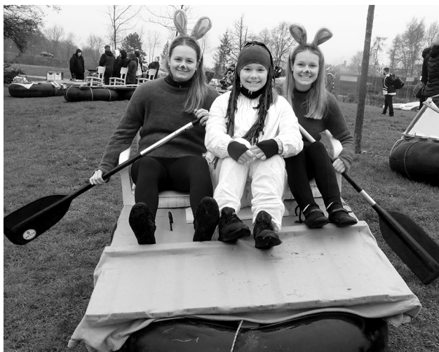
Sestry Tulachovy si vyzkoušely, jaké to je sedět v jejich plavidle, před startem ještě na suchu.

Na startu jsme zastihli rovněž trojici kamarádek, z nichž dvě měly na hlavách nádherné červenočerné klobouky. Jsou pirát-