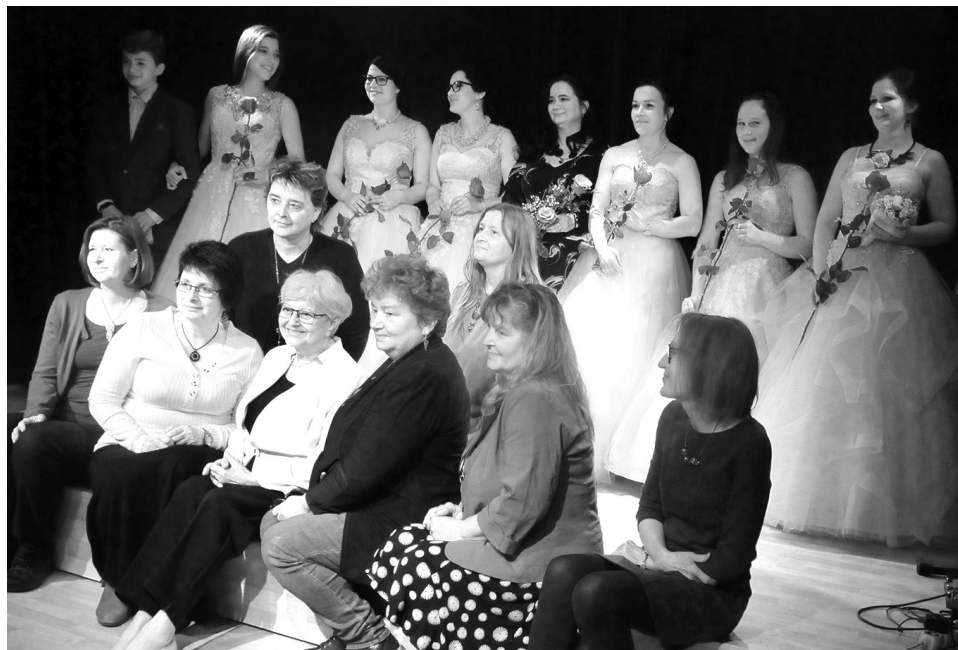
V závěru vernisáže se na pódiu setkaly modelky s Korálkárkami.

projekt pomáhá nevidomým dětem i dospělým z celé republiky. Stále také učím na konzervatoři.“