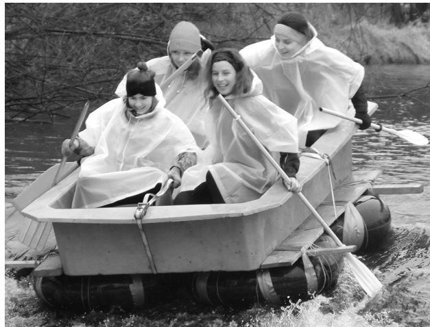
Na trať se vydal i tento bazén s dívčí posádkou.

se do studené vody moc nechtělo, ale přesto občas pokaždé, tedy pokud se akce konala," svěřil se Jiří