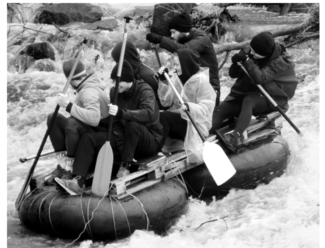
Některé „lodě“ měly až šestičlenné posádky.

dorazila z Tábora a Sezimova Ústí. „Poprvé jsme velikonoční Mastník sjížděli v roce 2014, a od té doby jsme tady