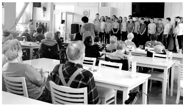
Příjemná jarní atmosféra zaplnila jídelnu Domova.

O hudební produkci se postaral Big Band Blue Orchestra, který je známý nejen pro své swingové melodie, ale také proto, že je plný žesťových nástrojů. V současné době tvoří orchestr 20 členů, z toho je šest saxofonů, čtyři trombony a tři trumpety. Účastníkům plesu hráli muzikanti k tanci písně popové, rockové, swingové, bluesové a dokonce jednu lidovou. O zábavu se postarala také taneční skupina Slimka, která předvedla dvě choreografie. Filip Špale