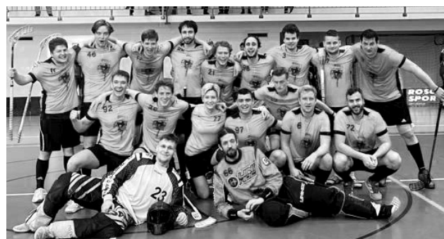
Spokojený domácí tým po úspěšném turnaji

K velkému potěšení fanoušků se tým v domá-