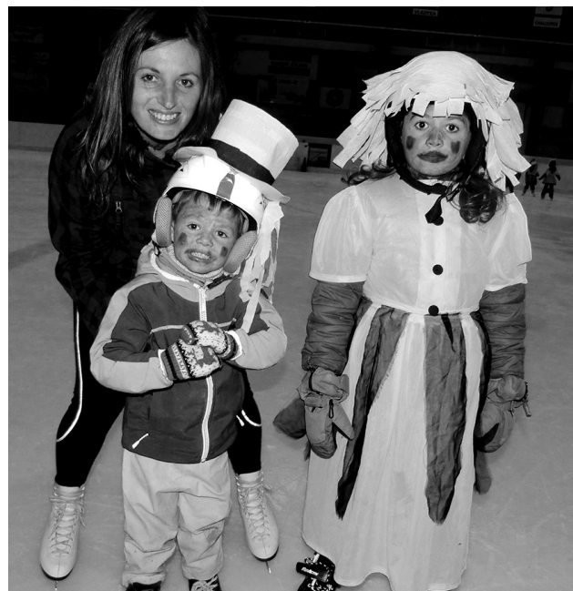
Na ledě byla mezi maskami hodně vidět dvojice vodníků.

V závěru karnevalu na ledě byly vyhlášeny tři nejhezčí masky, oceněn