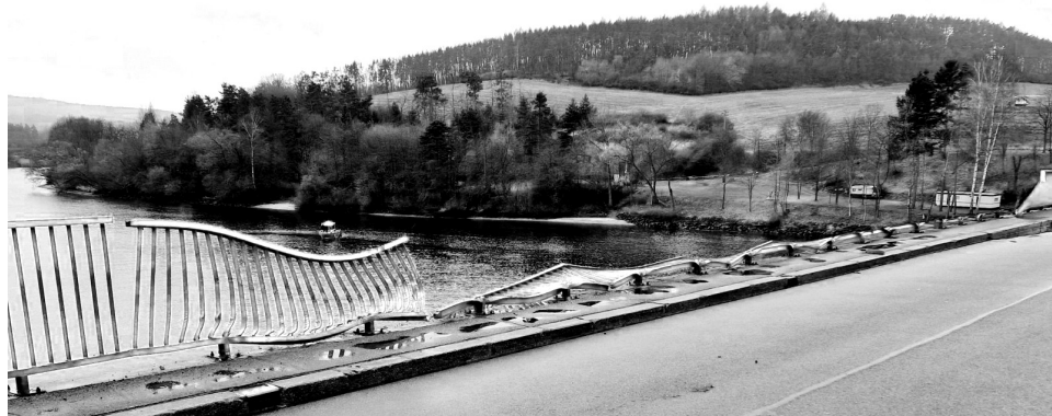
Oprava zničeného zábradlí na mostě začala hned v pondělí.