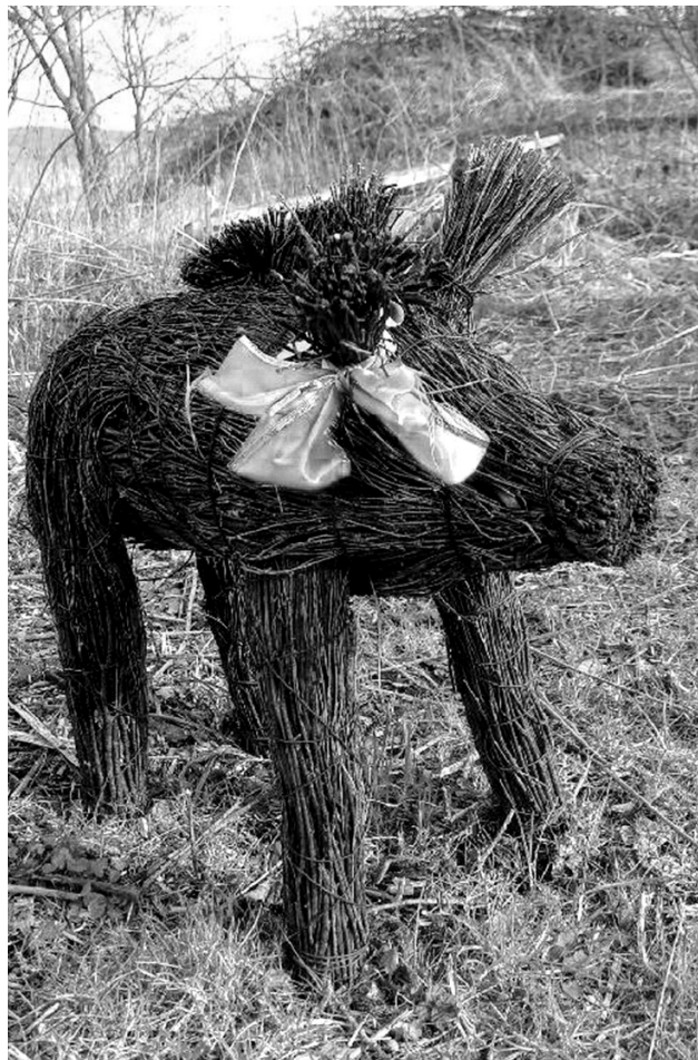
Dívoké prase, dohlížející na pořádek u petrovického rybníka Trubáček, jistě mile potěší oko nejednoho pocestného.