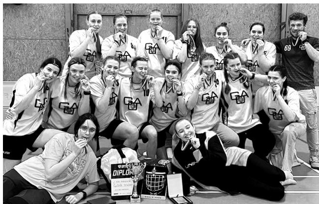
Sedlčanské florbalistky se stříbrnými medailemi z národního kola

Favorizovaný soupeř působil velmi dravě a profesionálně, sedlčanské gymnazistky se však nenechaly zastrašit prvním dojmem. Bojovnou hrou, která vycházela především z precizní obrany, florbalistky GaSOŠE soupeřky nepustily do jakéhokoliv nátlaku a zvítězily 3:2. Druhý zápas proti škole z Chomutova tým trochu podcenil. Soupeř byl lépe sehraný, a tak výsledek zápasu 5:1 nedopadl ve prospěch Sedlčanských. Třetí rozhodující utkání o postup do play-off však dívky pečlivě pojistily. Věděly velmi dobře, o co se hraje, a tak si celý zápas pohlíbdaly a nad plzeňskou zdravotnickou školou vyhrály 4:1.