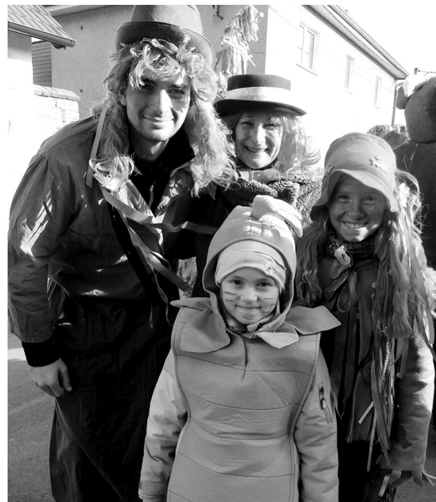
V Příčovech byla i celá vodnická rodina.

Pokud k Tučnému čtvrtku patří hojnost dobrého jídla a pití, v tomto směru