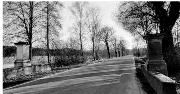
Známé sochy stojící při silnici č. 105, u nichž se s oblibou troubí, se zhruba za půl roku vrátí z restaurátorské dílny na své místo.

pa a sv. Jana Nepomuckého. Ukradl je snad někdo? Ale kdeže, sochy jsou díky