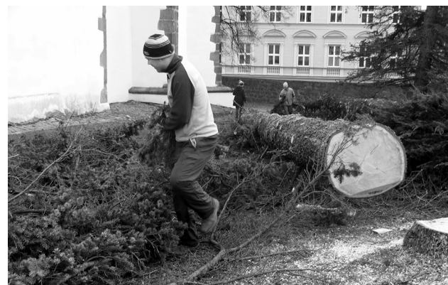
Sedlčanští farníci se měli v sobotu na zahradě u kostela co otáčet. Více na str. 2

BENEŠOV Studenti oktávy, 4. G a 4. OA GaSOŠE Sedlčany společně zorganizovali v sobotu 11. února od 19 hodin maturitní ples. Akce se podle tradice vrátila zpátky do prostoru Kulturního domu Karlov v Benešově, minulý rok se výjimečně konala v Krásné Hoře nad Vltavou. Na základě filmového tématu plesu patřil každé třídě jeden světoznámý