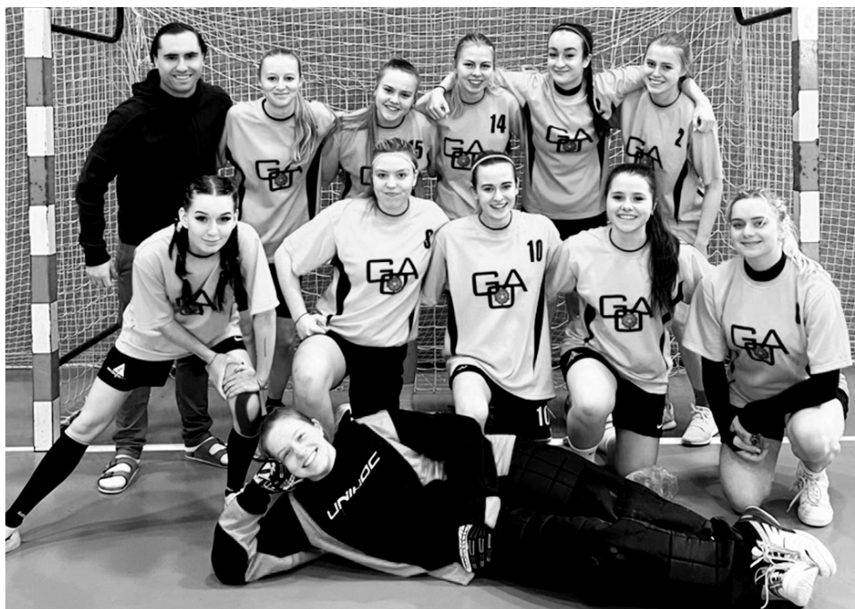
Tým GaSOŠE Sedlčany