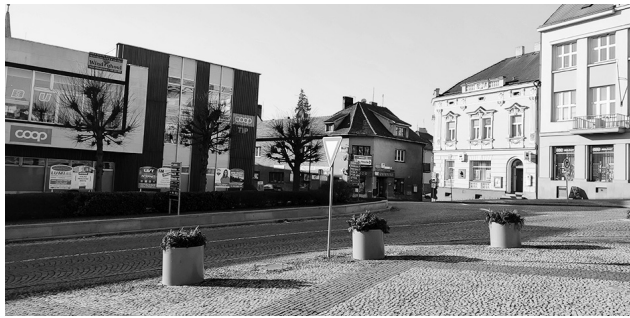
Jaké bude řešení křižovatky ve spodní části náměstí, ukáže čas.

„Jedním z témat při jednání rady města, u které byla rozsáhlá diskuse, bylo zkapacitnění průjezdu náměstím. V ranních