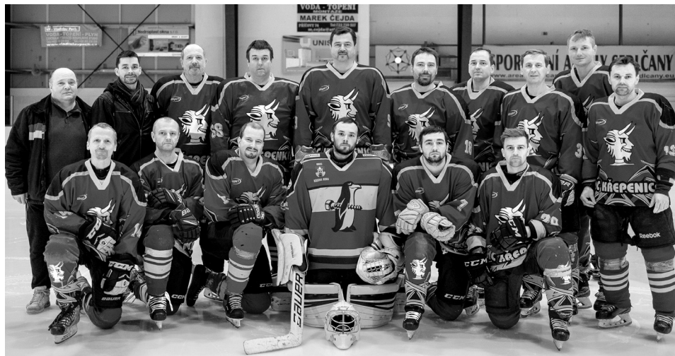
Čerti z Křepeňic stále bojují o čelo druholigové tabulky. Fanoušky ale jejich poslední zápas nepotěšil.

ale šest a půl minuty před koncem se jim povedlo rozebrat obranu soupeře, před brankářem se ocitli osamoceni hned dva hráči a Vladimír Kuchár přivedl Zvírotice opět do vedení. Hned vzápětí přidal čtvrtý