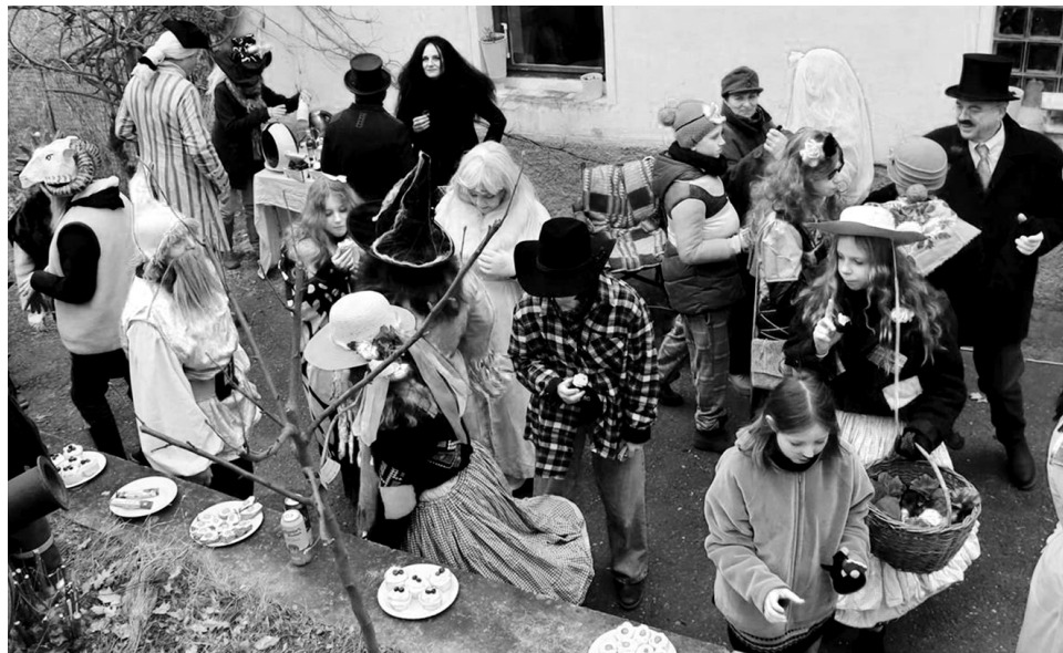
Ve Svatém Janu se u myslivny na masopustním veselí v sobotu 11. února sešlo přibližně šedesát masek. Do cíle průvodu ve Skřýšově jich dorazila zhruba polovina.