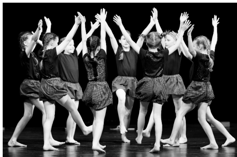
Hmyzí hemžení na jevišti.

smysl, chci, aby v tom existovaly, jdeme po fotkách, po filmech. Pro mě je to odměna, když mají děcka radost. Pak je to i má radost, člověku se vrací vydaná energie.